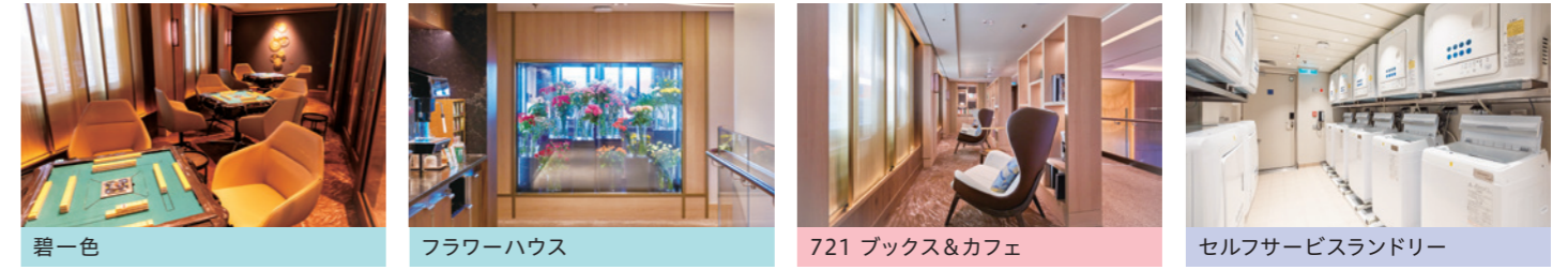
碧一色 フラワーハウス 721 ブックス&カフェ セルフサービスランドリー