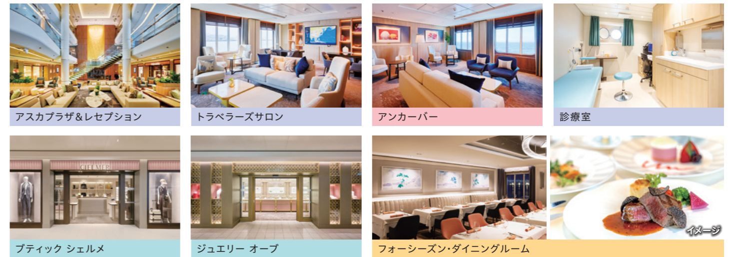
アスカプラザ&レセプション トラベラーズサロン アンカーバー 診療室 プティック シェルメ ジュエリー オープ フォーシーズン・ダイニングルーム