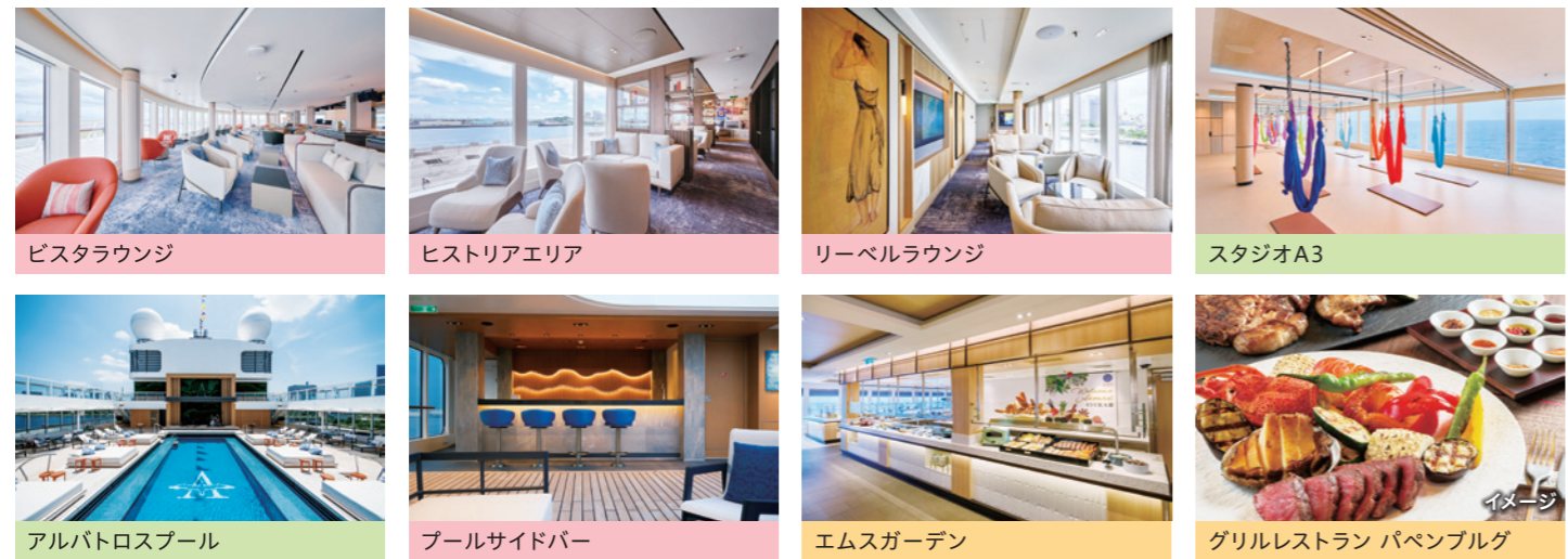
ピスタラウンジ ヒストリアエリア リーベルラウンジ スタジオA3 アルパトロスパール プールサイドバー エムガーデン グリルレストラン パペンプルグ