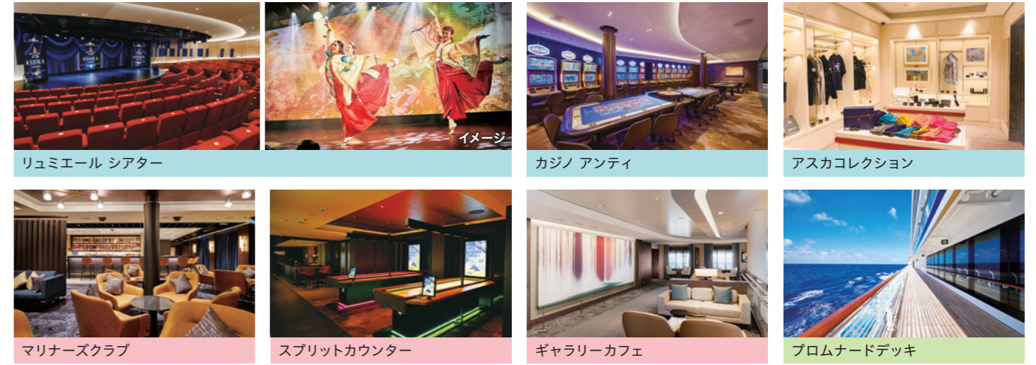
リュミエール シアター カジノ アンティ アスカコレクション マリナーズクラブ スプリットカウンター ギャラリーカフェ プロムナードデッキ