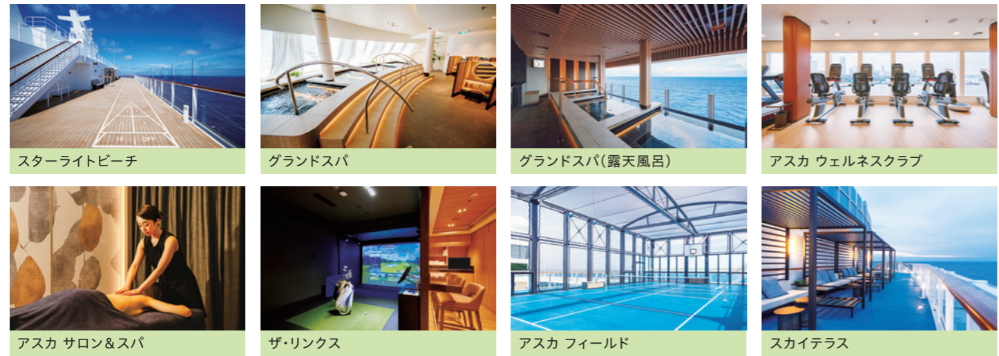
スターライトビーチ グランドスパ グランドスパ(露天風呂) アスカ ウェルネスクラブ アスカ サロン&スパ ザ・リンクス アスカ フィールド スカイテラス