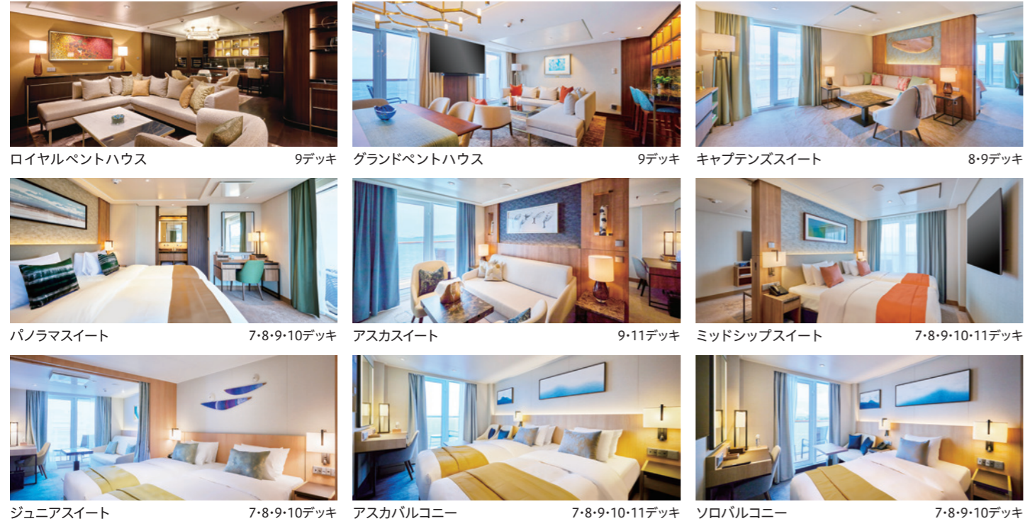
ロイヤルpentハウス 9デッキ グランドpentハウス 9デッキ キャプテンズスイート 8・9デッキ パノラマスイート 7・8・9・10デッキ アスカスイート 9・11デッキ ミッドシップスイート 7・8・9・10・11デッキ ジュニアスイート 7・8・9・10デッキ アスカバルコニー 7・8・9・10・11デッキ ソロバルコニー 7・8・9・10デッキ