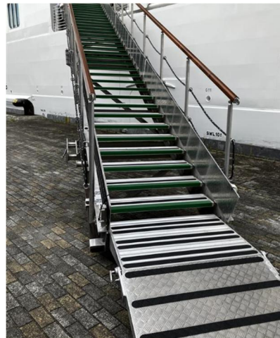
[階段状タラップ(イメージ)]