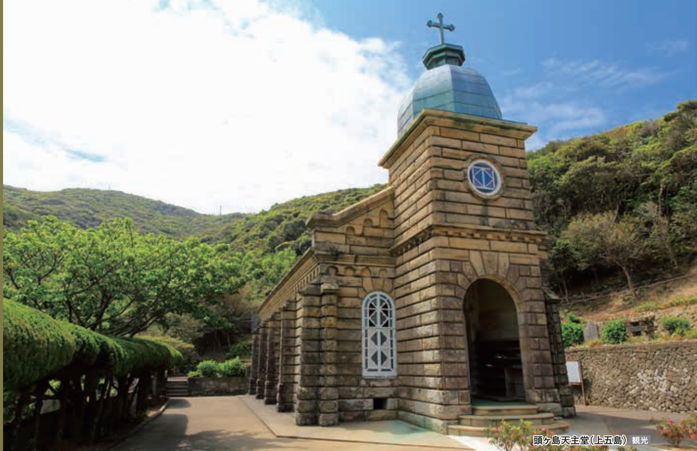
頭ヶ島天主堂(上五島) 観光